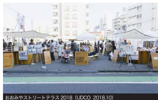
おおみやストリートテラス 2018 (UDCO 2018.10)