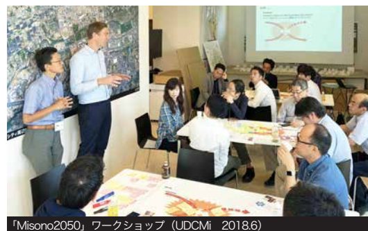
「Misono2050」ワークショップ (UDCMi 2018.6)